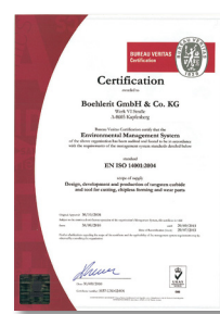
Zertifikat EN ISO 14001:2004 Certificate EN ISO 14001:2004